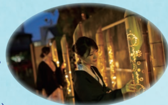
伊東温泉竹あかり

市内では毎日、竹でできた灯籠”竹あかり”を点灯させ、 伊東市街地を統一した和の雰囲気演出しています(伊東温泉竹あかり~イルミロマン・ジャパネスク~)。 この機会に通常プランより3,000円お得にご案内いたします。